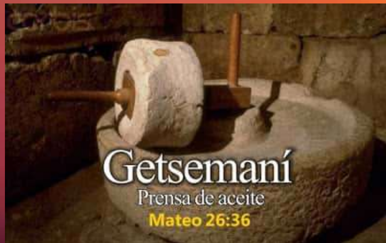
Getsemaní Prensa de aceite Mateo 26:36