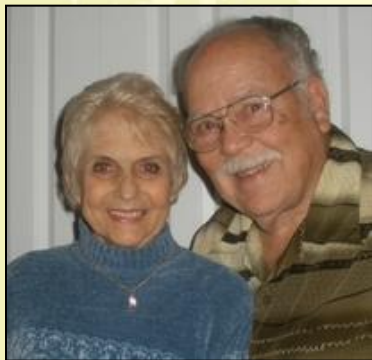
John & Dotty Davis Int'l House of Philoxenia,